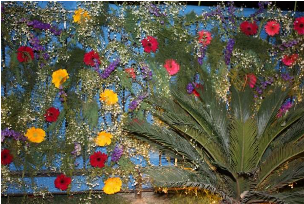
Soirée Printemps

Le printemps est là, Delhi Accueil ne chôme pas !