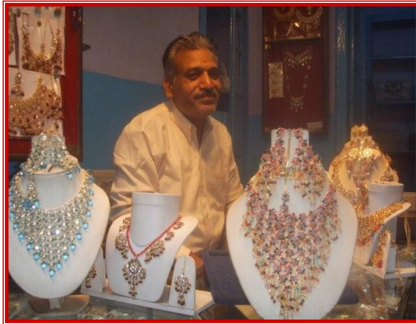
Vitrine de parures